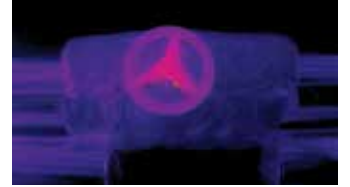
İzocam Vana Ceketini uygulamasından sonra yalıtımlı vananın termal kamera görüntüsü