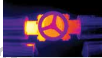
Yalıtımsız vananın termal kamera görüntüsü

Yalıtımı yapılacak vanaya uygun vana ceketini seçilir veya özel olarak dikiş yapılır. Vana ceketini, vananın etrafına sarılır ve yay yardımıyla kopçalar birbirine sıkıca bağlanır. Montajdan önce vanalarda buhar kaçağı olup olmadığı kontrol edilir. Kaçak tespit edilirse, arıza giderildikten sonra uygulamaya başlanır. Uygulamada vana ve flanşlar tamamen yalıtılmalı, vana ceketini, vananın bağlı olduğu yalıtımlı boru üzerine flanşlardan itibaren en az 50 mm bindirilmelidir.